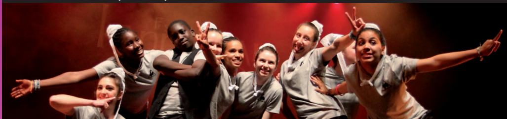
Fête le Mur et Eskell an Elorn De l'autre côté du mur