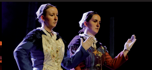
Revival Déclinaison dansée autour du laridé et de l'aéroplane