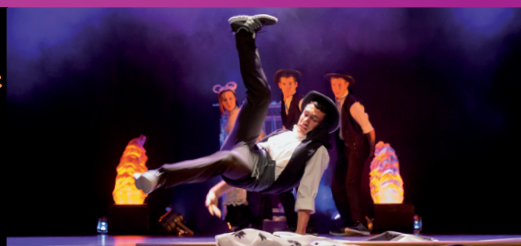
Anima'Niak Acrimonie Crew