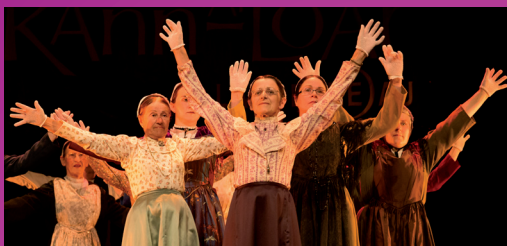
Revival Tei et mei pour une petite danse