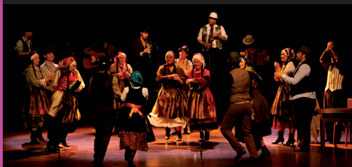
Collectif Ar Famiji Un deiz a-dreist an deizioù arall...